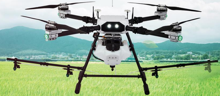
PREX - Q16 약제통 16L