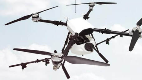
PREX - Q10 약제통 10L